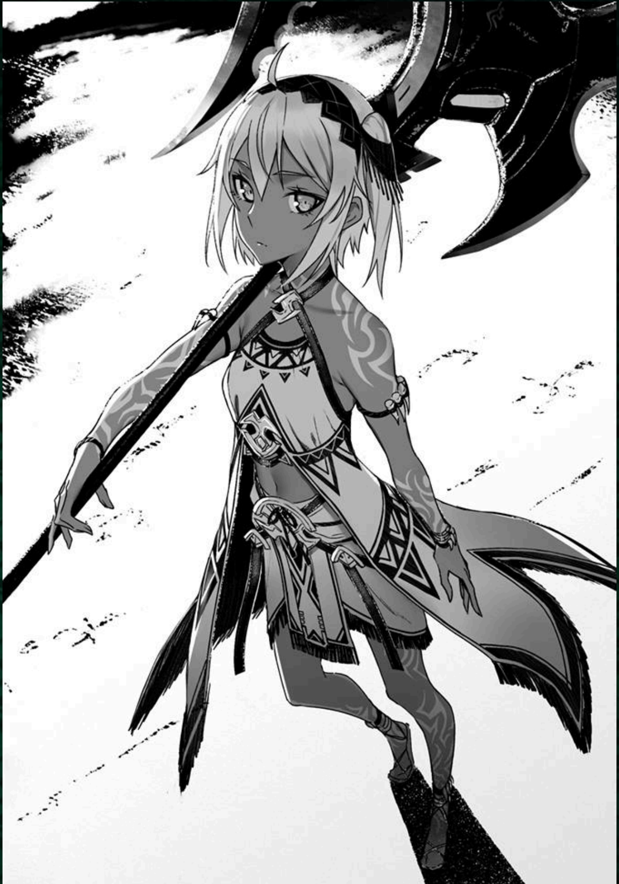
Berserk of Gluttony