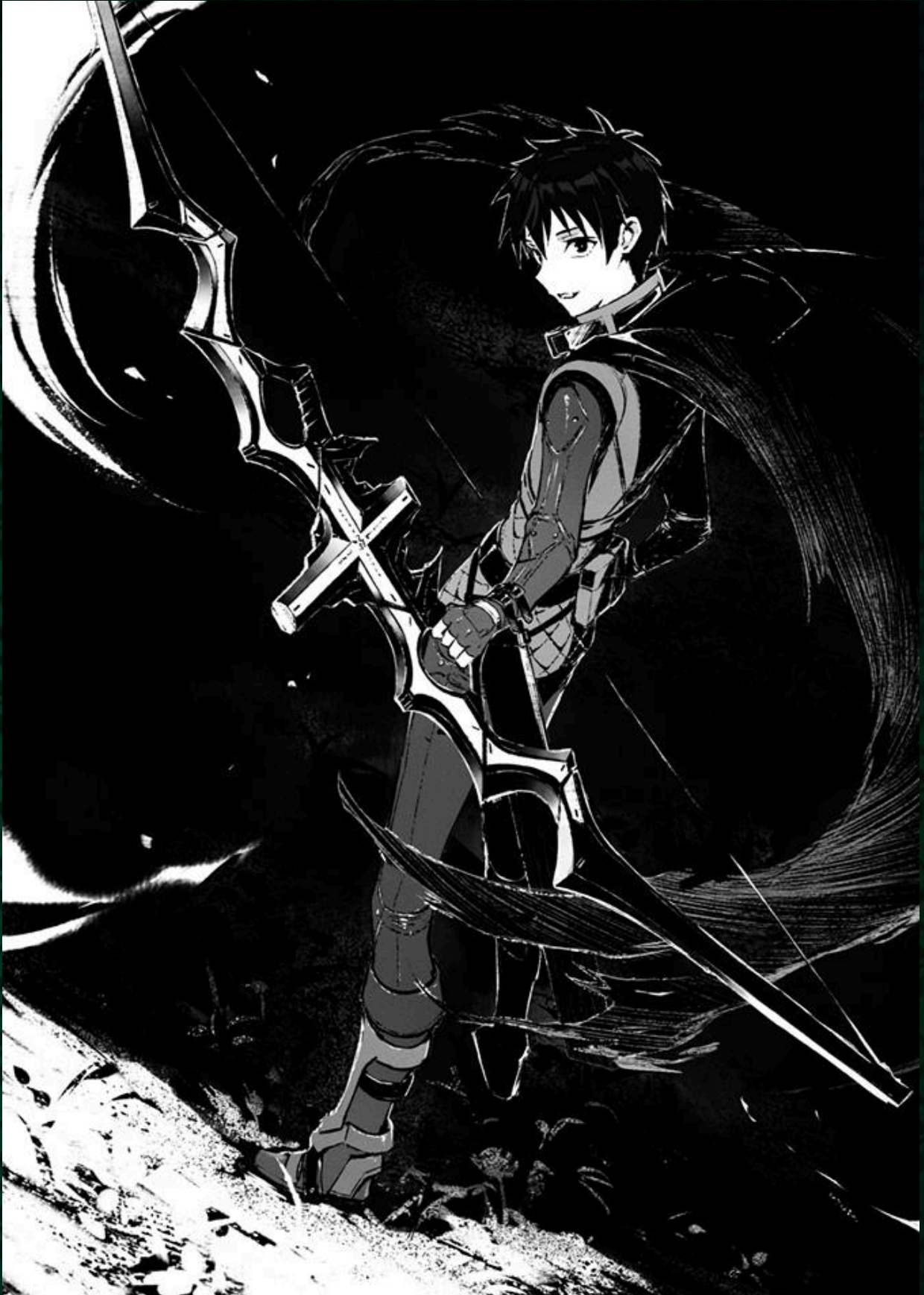
Berserk of Gluttony