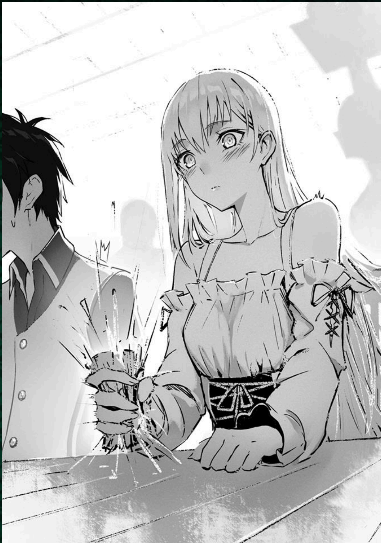
Berserk of Gluttony