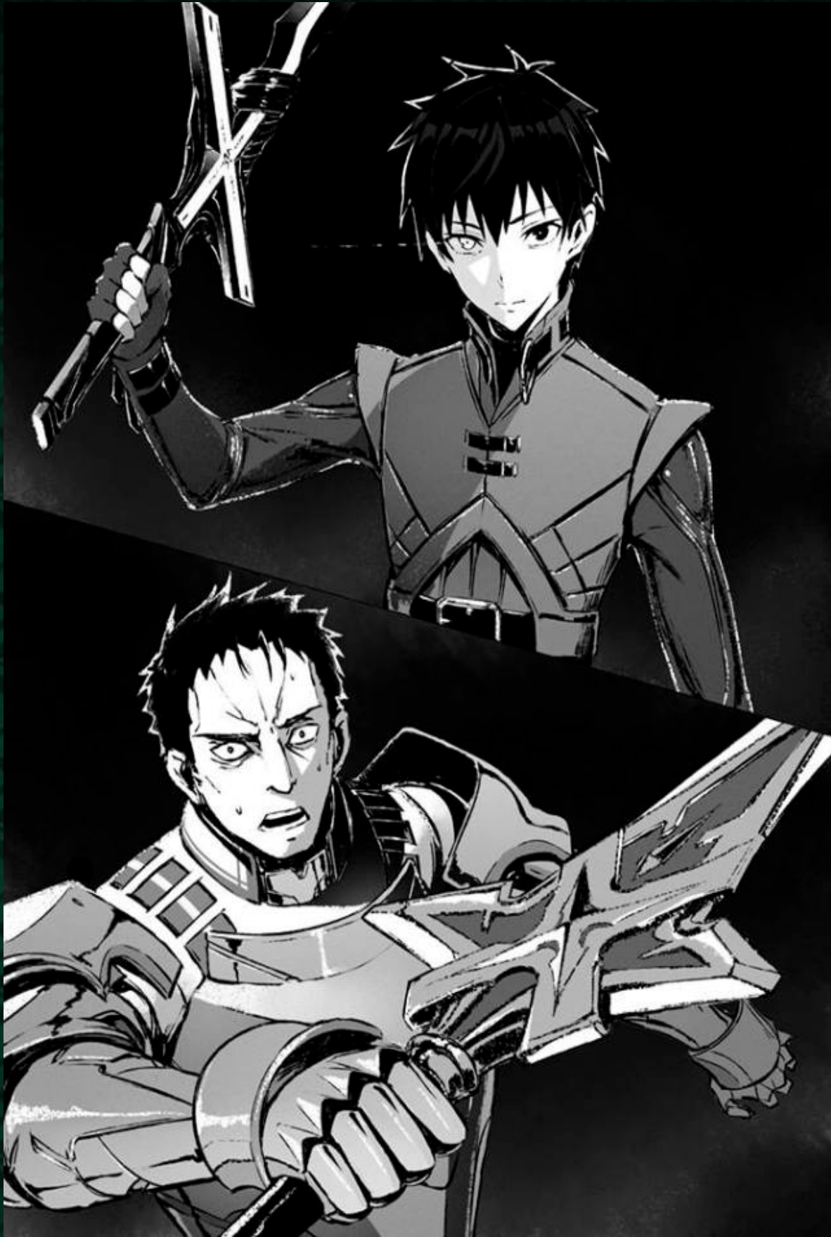
Berserk of Gluttony